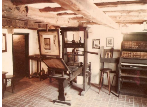
გუტენბერგის საბეჭდი დაზგა

კომუნიკაციის ფორმების შემდგომი განვითარება ფოტოგრაფიის, ხმის ჩანერისა და კინოს გამოგონებას უკავშირდება (ფონოგრაფიული და კინემატოგრაფიული რევილუცია). XX საუკუნის II ნახევარში, ინტერნეტის შექმნასა და განვითარებასთან ერთად, აღნიშნული პროცესები ერთმანეთთან შერწყმის ტენდენციას ამჟღავნებს. ინტერნეტი გახდა ისეთი ტექნოლოგია კაცობრიობის ისტორიაში, სადაც სხვადასხვა მედიუმ 2 (დამწერლობა, აუდიო და ვიდეომასალა) ჰარმონიულად ერწყმის ერთმანეთს. ამიტომ, თანამედროვე სამყაროში საუბრობენ მედიათა შერწყმის (media merging) პროცესზე და ინტერნეტზე, როგორც ჰიბრიდ-მედიუმზე . ამ მიდგომის თანახმად, ინტერნეტი რაღაც თვისებრივად ახალი მედია კი არ არის, არამედ ის ტექნოლოგიაა, რომელშიც განსხვავებულ მედიები ციფრულ ფორმატში ინტეგრირდებიან.