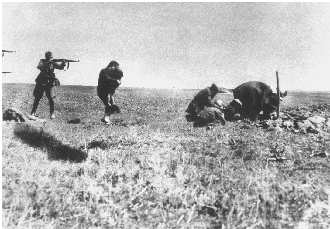
ფაშისტები კლავენ ქალებს და ბავშვებს ივანგოროდის (უკრაინა) ახლოს, 1942 წ.

დამატებით სირთულეს წარმოადგენს ის გარემოება, თუ როგორ უნდა „გაზომოს“ სამართლიანმა მეტროლომა ზიანის განაწილება ყველა მხარეს შორის (საკუთარი და მონინაალმდეგის ჯარისკაცები, საკუთარი და მტრის სამოქალაქო მოსახლეობა). ტრადიციული შეხედულების თანახმად, მეთაურები, პირველ რიგში, საკუთარი ჯარისკაცების მიმართ არიან ვალდებულნი. უდანაშაულო მოქალაქეების მიმართ მათი ვალდებულება შედარებით მეორხარისხოვანია. თუმცა, ზოგიერთი ავტორის აზრით, მეთაურები მორალურად ვალდებულნი არიან, გარკვეული რისკები საკუთარ თავზე აიღონ იმისთვის, რათა სამოქალაქო პირები (მონინაალმდეგის მოქალაქეთა ჩათვლით) დაიცვან. 36 ტესონი მიიჩნევს, რომ ეს საკითხი კიდევ უფრო რთულდება შემდეგი გარემოებების გამო: 1. ყველა მოქალაქე არ არის უდანაშაულო (ზოგიერთი მათგანი შესაძლოა, მონინაალმდეგეს უწყობდეს ხელს); 2. ერთმანეთისგან უნდა განვასხვაოთ ის მოქალაქეები, რომლებიც უბრალოდ არ ერევიან კონფლიქტში და ისინი, რომლებიც სამხედრო მოქმედებების შედეგად გარკვეულ სარგებლის მიღებას ელიან; 37 3. სამოქალაქო პირთა სიკვდილის მიზეზი ხშირად არის უსამართლო მონინაალმდეგე, რომელიც სამართლიანი მტრის წინააღმდეგ მოქმედებს. ტესონს მაგალითად მოჰყავს სამოქალაქო მსხვერპლი ავღანეთში, რომლის მთავარ მიზეზად იგი თალიბანს ასახელებს. 38 თუმცა, მისი აზრით, ეს მსხვერპლი არ იქნებოდა იმ შემთხვევაში, ნატო-ს ავღანეთში სამხედრო მოქმედებები რომ არ დაენყო. შესაბამისად, მისი აზრით, ბუნდოვანია, თუ როგორია სამართლიანი მეტროლოლის პასუხისმგებლობა ასეთი სახის მსხვერპლის შემთხვევაში.