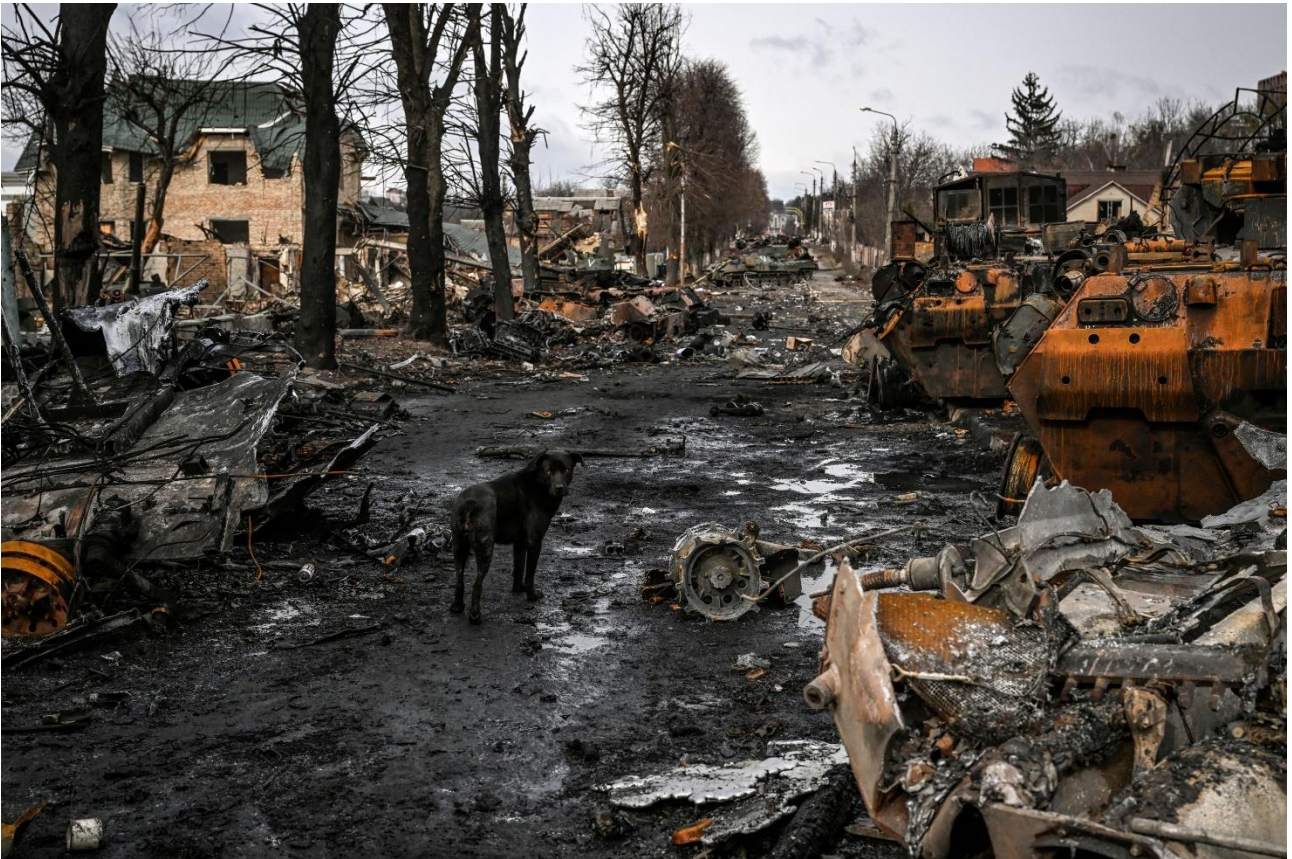
რუსეთის ფედერაციის თავდასხმის შედეგად განადგურებული ქალაქი ბუჩა (უკრაინა), 2022 წ.

უკანასკნელი ცვლილების თარიღი: 10.12.2022