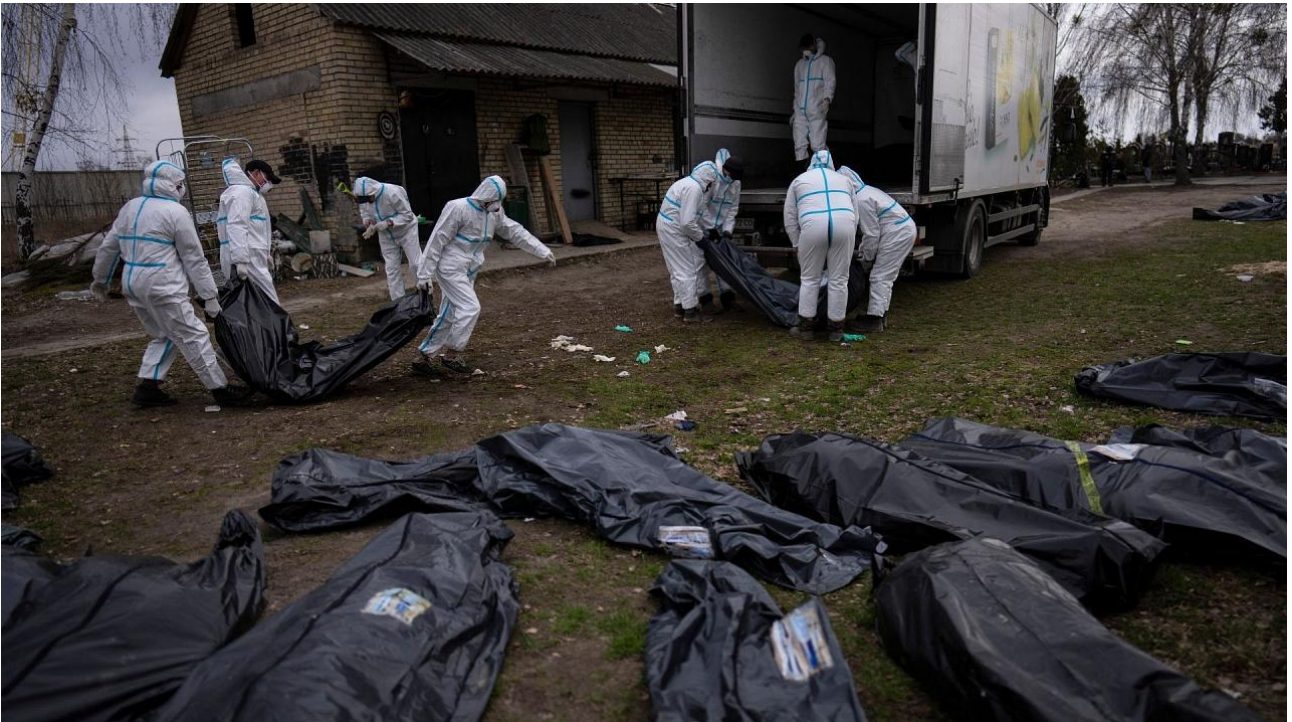
უკრაინის ქალაქ ბუჩაში რუსეთის ფედერაციის შეიარაღებული ძალების მიერ დაზოცილი სამოქალაქო პირები: განზრახული მკვლელობის მსხვერპლნი

მესამე დებულებაში არსებული სამართლიანი მიზეზი საკმაოდ დამაჯერებელი და ძლიერი უნდა იყოს, რათა თანმდევი მსხვერპლის კომპენსირება მოახდინოს. ამ პირობის თანახმად, არსებობს მორალური აუცილებლობის განსხვავებული ხარისხები, რაც იმას ნიშნავს, რომ ყველა სახის სამართლიანი მიზეზი ვერ გაამართლებს თანმდევ მსხვერპლს. თუმცა, რაც უფრო ძლიერი და მასშტაბურია მიზეზი, მით უფრო დაბალია ზღვარი თანმდევი მსხვერპლისთვის (მაგალითად, ეროვნული თავდაცვის შემთხვევაში ასეთი ზღვარი უფრო დაბალი იქნება, ვიდრე უბრალო რეგიონალური სამხედრო კონფლიქტის შემთხვევაში).