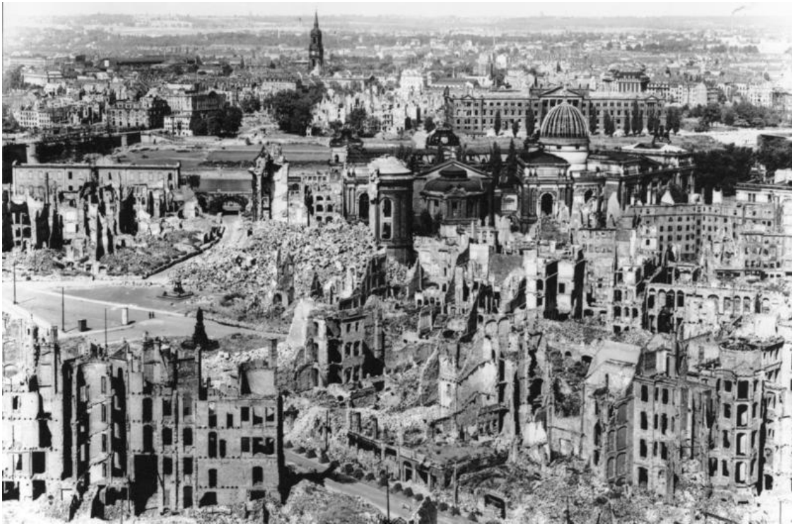
მოკავშირეების მიერ დაბომბილი დრეზდენი

როგორც წესი, მიიჩნევა, რომ პროპორციულობა ომში სამართლიანი მიზეზის ქონისგან დამოუკიდებელია. მეორე მსოფლიო ომის დროს, 1945 წლის 13-დან 15 თებერვლის ჩათვლით, მოკავშირეებმა, კერძოდ, ბრიტანულმა და ამერიკულმა ავიაციამ დაბომბა გერმანული ქალაქი დრეზდენი. დაბომბვების შედეგად დაახლოებით 25 000-მდე ადამიანი დაიღუპა. ეს ნაბიჯი არაპროპორციული იყო მიუხედავად იმისა, რომ მოკავშირეები სამართლიან ბრძოლას აწარმოებდნენ.