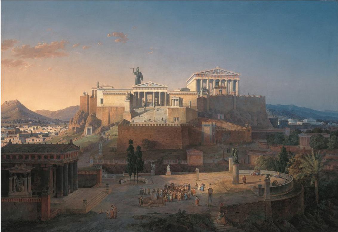
ათენის აკროპოლისი. ლეო ფონ კლენცე (1846 წ.)

არისტოტელეს თანახმად, პოლიტიკური მეცნიერება ისე მიემართება პოლიტიკოსის ამოცანებს, როგორც მედიცინა – ექიმის საქმიანობას („პოლიტიკა“, წიგნი IV.1). ის არის ცოდნის ერთობლიობა, რომელსაც მისი მიმდევრები შეიძენენ მოცემულ დარგში საქმიანობის შედეგად. პოლიტიკოსის ყველაზე მნიშვნელოვანი ამოცანა კანონმდებლად ყოფნაა, ანუ ქალაქ-სახელმწიფოსთვის შესაფერისი სახელმწიფო წყობის ჩამოყალიბება. ეს გულისხმობს მოქალაქეებისთვის მყარი კანონების, წეს-ჩვეულებების და ინსტიტუტების (მორალური განათლების სისტემის ჩათვლით) შექმნას. როდესაც სახელმწიფო წყობა შექმნილია, პოლიტიკოსმა ადეკვატური ღონისძიებები უნდა გაატაროს მის შესანარჩუნებლად. მან რეფორმებიც უნდა განახორციელოს, თუკი ამას საჭიროდ ჩათვლის და აღკვეთოს ის ცვლილებები, რომლებმაც, შესაძლოა, ძირი გამოუთხარონ არსებულ პოლიტიკურ სისტემას. სწორედ ესაა საკანონმდებლო მეცნიერების საქმე, რომელსაც არისტოტელე უფრო მნიშვნელოვნად მიიჩნევდა ვიდრე პოლიტიკას, რომელიც ყოველდღიურ პოლიტიკურ ცხოვრებაში (მაგალითად, დადგენილებების მიღებაში) გამოიხატება („ნიკომახეს ეთიკა“, VI.8).