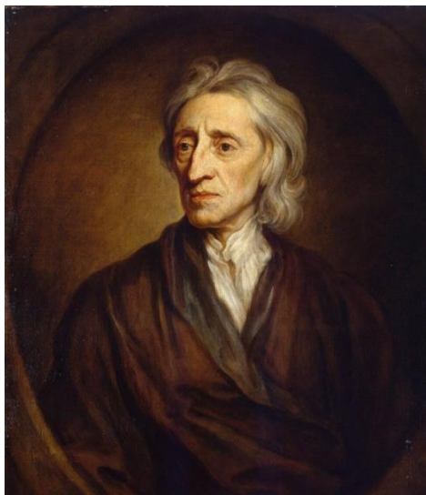
ჯონ ლოკი. მხატვარი: სერ გოდფრი ნელერი (1697 წ.)

ლიბერალურ ტრადიციას განეკუთვნებიან შემდეგი მოაზროვნეები: ჯონ ლოკი, ადამ სმითი, შარლ ლუი მონტესკიე, თომას ჯეფერსონი, ჯონ სტიუარტ მილი, ლორდი ექტონი, თომას ჰილ გრინი, ჯონ დიუი, ისაია ბერლინი, ჯონ როულსი და სხვ. თუმცა, აღსანიშნავია რომ ეს მოაზროვნეები ერთმანეთისგან განსხვავდებიან იმის მიხედვით, თუ როგორ აფასებენ შემწყნარებლობის საზღვრებს, კეთილდღეობაზე ორიენტირებული სახელმწიფოს ლეგიტიმურობას და დემოკრატიის დადებით ასპექტებს. ისინი ბოლომდე იმაზეც კი ვერ თანხმდებიან, თუ რა წარმოადგენს თავისუფლების ბუნებას. საერთოდ, უნდა აღინიშნოს, რომ ყოველი იდეოლოგიის „შიგნით“ მოაზროვნეებს შორის დაუსრულებელი კამათი მიმდინარეობს ამ იდეოლოგიის შემადგენელი ძირითადი ცნებების შესახებ. თუმცა, ეს თეორეტიკოსთა დაბნეულობით კი არ უნდა ავხსნათ, არამედ იმ ფაქტით, რომ ინტელექტუალთა ყოველი მომდევნო თაობა ცდილობს, თავისებურად გაიაზროს ძირითადი ცნებები ახალი გამოცდილების ქრილში.