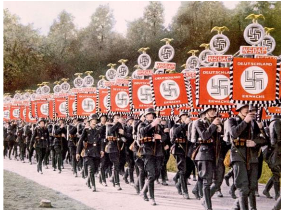
ფაშიზმი ხშირად წარმოაჩენს თავს ტრადიციულ ღირებულებებზე ორიენტირებულ, კონსერვატორულ იდეოლოგიად, თუმცა სინამდვილეში ეს ასე არ არის.

ლიდერი ქარიზმატული მმართველია, ხოლო კონსერვატორი მმართველი ტრადიციულ მმართველობას ახორციელებს.