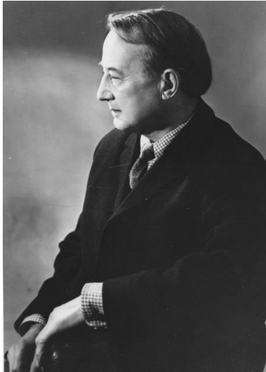
ინგლისელი ფილოსოფოსი მაიკლ ოუქშოტი (1901-1990) XX ს-ის ერთ-ერთ ყველაზე ცნობილ კონსერვატორ მოაზროვნედ ითვლება.

ქვემოთ მოკლედ განვიხილავთ რამდენიმე იდეოლოგიას, რომლებსაც ხშირად აკავშირებენ კონსერვატიზმთან, თუმცა, ასეთი დაკავშირება არამართებულია. ეს იდეოლოგიებია: ფაშიზმი, ავტორიტარიზმი და ელიტიზმი.