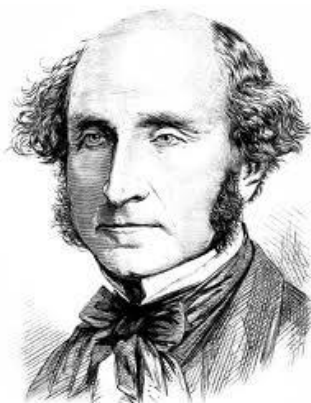
ჯონ სტიუარტ მილი

ლიბერალური ფემინიზმი გენდერული უთანასწორობის მიზეზებს საზოგადოებაში არსებულ სოციალურ და კულტურულ დამოკიდებულებებში მიიჩნევს. ამ მხრივ მნიშვნელოვანი წვლილი შეიტანა ინგლისელმა ფილოსოფოსმა ჯონ სტიუარტ მილმა (1806-1873 წწ.), რომელმაც 1869 წელს გამოსცა ნაშრომი „ქალთა დაქვემდებარება“ ( The Subjection of Women ). ამ ნაშრომში მილი მოითხოვდა სქესთა შორის სამართლებრივ და პოლიტიკურ თანასწორობას, ასევე, საარჩევნო უფლებას ქალებისთვის.